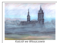
Kościół we Włoszczowie

Kolejną grupę zabytków sakralnych stanowią kościoły barokowe będące najczęściej fundacjami rodów szlacheckich - ówczesnych właścicieli miast czy wiosek, w których je wznoszono. Wczesnobarokowy kościół p.w. Wniebowzięcia NMP i św. Floriana w Czarnicy został wybudowany w latach 1640-1659 staraniem Stefana Czarnieckiego i stał się później jego mauzoleum. Szczęśliwie przetrwał w 1937 r. przełożono z krypty do okazałego sarkofagu projektu Józefa Trautskircha-Kamilskiej umieszczającego w prezbiterium kościoła. W bocznej kaplicy zgromadzono pamiątki po Czarnieckim, m.in.: niewielki XVII-wieczny obraz Matki Boskiej z ołtarza polowego hetmana, jego konny portret oraz naczyńia i szaty liturgiczne jego fundacji. Najcenniejsze świątyni, w miejscu gdzie prawdopodobnie stał dwór Czarnieckich, w latach 60-tych lub. 70-tych ub. służyła jako zagon park-carbonetum, gromadzący szereg ciekawych gatunków drzew i krzewów. Z tego samego okresu pochodzi kościół p.w. Wniebowzięcia NMP w Olesznie z jednolitym stylizacyjnie, barokowym wyposażeniem wnętrza. Szczególnie warto zwrócić uwagę na ciekawą dekorację stiukową oraz obraz Matki Boskiej z Dzieciątkiem przeniesiony w 1680 r. ze zlikwidowanego kościoła w polskim Chotowie.