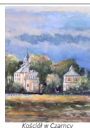
Kościół w Czarnicy

Połowa XVI i wiek XVII to okres ożywionego ruchu reformacyjnego na terenach obecnego powiatu. Setek kościołów zamieniono wówczas na zbory, a później rekatolizowano. Epizody takie miały kościoły w Moskorzewie i Seceminie oraz w wiele niezachowanych do dziś kościołów drewnianych. Z tych czasów pochodzą również: zbor arianski w Ludyni z poł. XVI w., zamieniony później na spichlerz dworski, ruiny zboru w Łąpczynie Woli z początku XVII w., tzw. mruwaniec w Moskorzewie z XVI w. wg tradycji mieszczący szkołę arianską oraz gotyckie ruiny w Gruszczynie z poł. XVI w. identyfikowane jako zbor arianski, albo jako kościół klasztorny p.w. św. Michała.