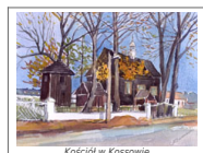
Kościół w Koszowie

Cennymi zabytkami architektury sakralnej są nieliczne zachowane budowle drewniane: kaplica cmentarna św. Anny w Kurzelowie z 1 poł. XVII w. oraz kościół parafialny p.w. Wszystkich Świętych w Koszowie z początku XVII w. i p.w. św. Michała Archanioła w Bebelnie z 1745 r. Tym ostatnim towarzyszą również współczesne im drewniane dzwonnice. Na ich tle wyróżnia się mająca obronny charakter drewniana dzwonnica przy kościele parafialnym w Kurzelowie z XVII-XVIII w.