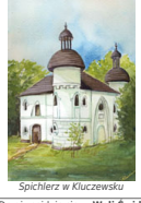
Spichlerz w Kluczewsku

Z kilkunastu istniejących po II wojnie światowej na terenach obecnego powiatu drewnianych dworów szlacheckich do dziś zachowały się dwa. Najciekawszy z nich dwór w Ludyni z ok. poł. XVIII w., malowniczo położony wśród stawów, "grał" filmowe dwory w ekranizacjach Szyfowych prac i Przedwieśnia Stefana Żeromskiego.