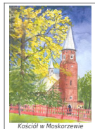
Kościół w Moskorzewie